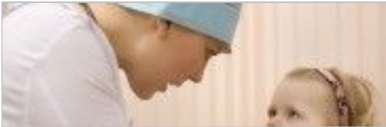
Dislalia, ¿qué es y cuándo tratarla?