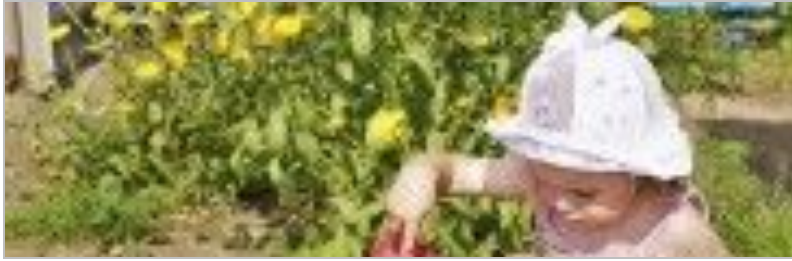
Juegos educativos para los niños en verano