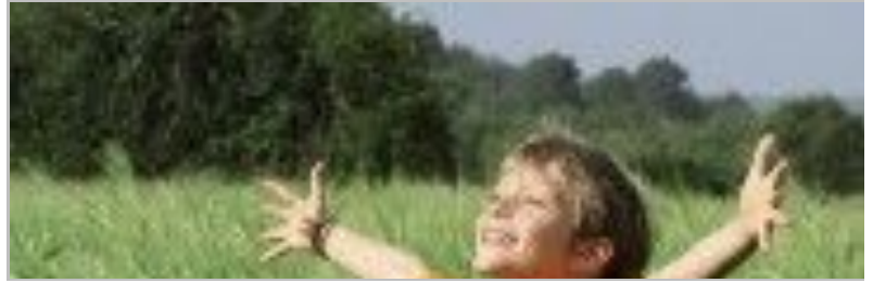
Elogiar demasiado a los niños, ¿es peligroso?